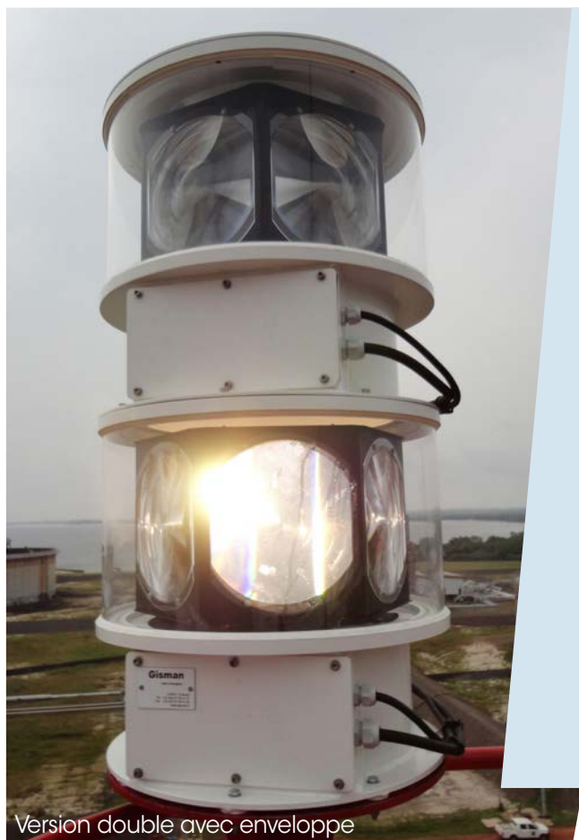
Version double avec enveloppe

Le feu tournant GISMAN GFT-200 est destiné au balisage de longue portée. Cet équipement est parfaitement adapté aux nouveaux phares et pour la réhabilitation de phares existants.